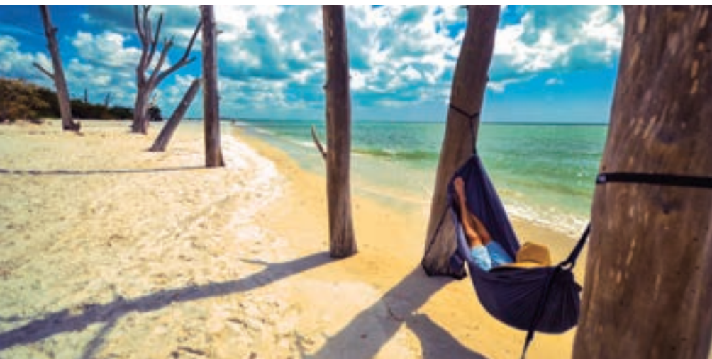
Kilómetros de playas y múltiples atractivos esperan al visitante en Fort Myers.

Lehigh Acres es el sitio ideal para disfrutar de canales de agua fresca, excelente pesca, tenis, equitación, además de senderos para excursionismo y ciclismo. Esta pacífica comunidad de campo ofrece alojamiento para familias a precios moderados. •