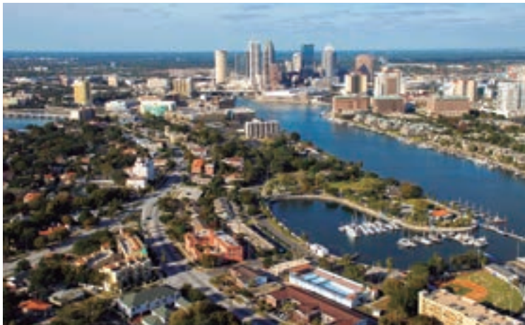
Davis Islands, un paraíso durante todo el año.

Informes: www.visittampabay.com / www.fortmyers-sanibel.com / www.visitstpeteclearwater.com/es .